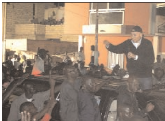
le leader de la Génération du concret lors d'une de ses sorties électorales (photo d'archives)

Enfin, le leader de la Génération du concret a salué les anciens du Parti démocratique sénégalais et cité feu Boubacar Sall et les Thiessois qui l'ont accompagné pour inscrire la marche du Pds vers